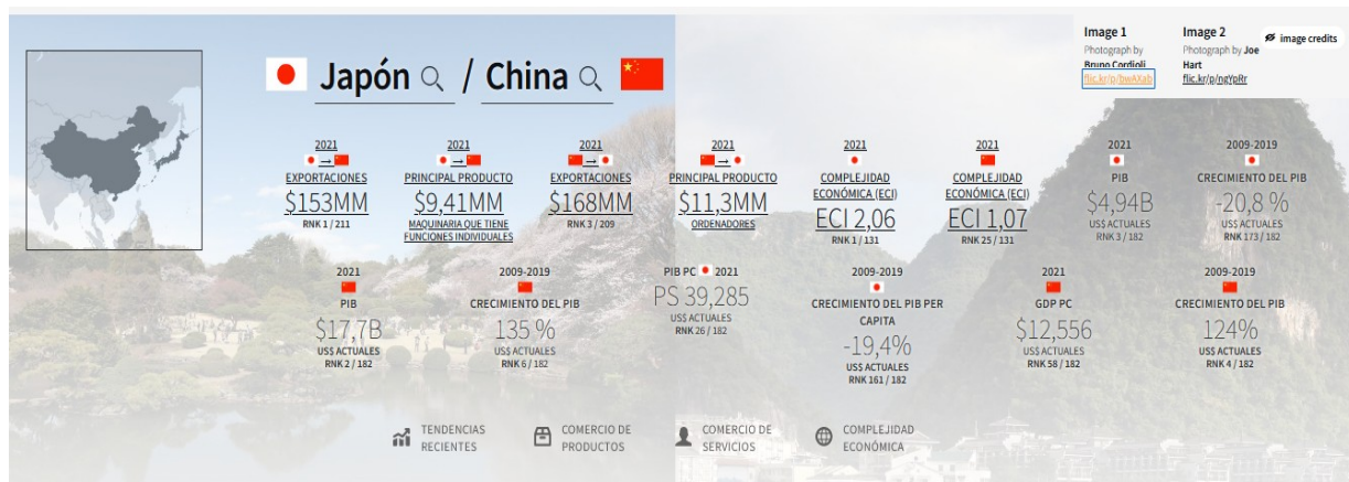
Figura 2: Comparación entre Japón y China en términos de exportaciones, PIB e Índice de Complejidad Económica en el 2021.

millones de dólares solo fueron en término de exportación de maquinarias con funciones individuales hacia el gigante asiático. Mientras que las exportaciones de China hacia Japón, ascendieron a un valor de 1698 mil millones de dólares; ocupando la posición número 3 en sus destinos de mercado a nivel mundial. En este escenario, el principal producto en este enlace comercial fueron los ordenadores (OEC, 2023). Véase Figura 2.